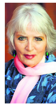
Minister Vogelaar.

Om de inburgeringscursus succesvoller te laten verlopen komt Vogelaar met een 'Deltaplan Inburgering'. Daarin staat dat het belangrijker is om de kwalite